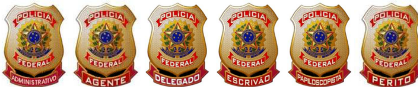
FIGURA 5 - VARIAÇÕES DO DISTINTIVO METÁLICO

1.24. A frente do emblema seguirá o padrão estabelecido pelo Manual de Identidade Visual da Polícia Federal e o Decreto nº 98.380/1989, de 9 de novembro de 1989, no que se refere às cores e proporções.