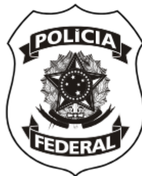
Versão 01 (uma) cor - traço Utilizada quando a reprodução de meios-tons não são possíveis ou comprometem a qualidade.