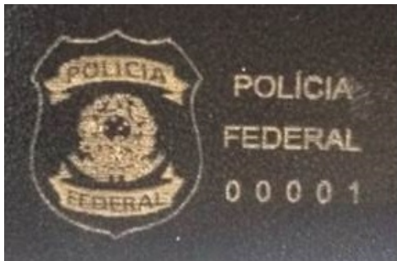
FIGURA 4 - GRAVAÇÃO NA ABA Nº 1, VISÃO EXTERNA (IMAGEM MERAMENTE ILUSTRATIVA)

1.15. O visor plástico, que será aplicado na aba nº 2, visão interna – FIGURA 1, será composto de um corte retangular de PVC (Filme Plastificado Composto 100% Policloreto de Vinila), tipo cristal transparente, com espessura mínima de 0,30 mm, com gramatura de 220g/m 2 a 270 g/m 2 , a transparência mínima é de 90,0%, incolor.