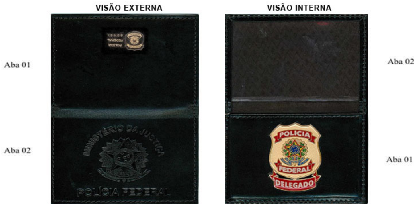
FIGURA 1 - PORTA FUNCIONAL (IMAGEM MERAMENTE ILUSTRATIVA)

1.9. Internamente, na aba nº 1 (visão interna – FIGURA 1), em forma de bolso, será afixado o distintivo, emblema + listel do cargo (FIGURA 2), da Polícia Federal em metal, medindo o emblema 45 mm de altura x 36 mm largura, +- 1,0 mm, e o listel do cargo, medindo 8 mm de altura x 36 mm de largura, +- 0,5 mm. As cores do emblema deverão seguir o padrão da Polícia Federal, conforme FIGURA 3.